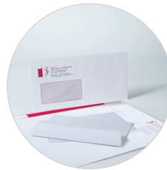
Briefbogen | Umschläge