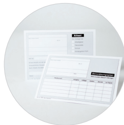
Praxisformulare | Vordrucke