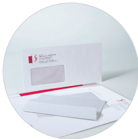
Briefbogen | Umschläge